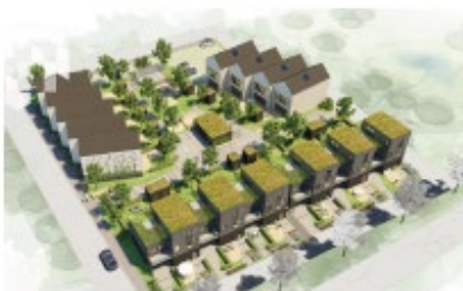
OBOs, 26 bostadsrätter Prel. byggstart våren 2021