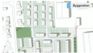
Flerfamiljshus, radhus, parhus och enbostadshus i Anderslöv Bostäder