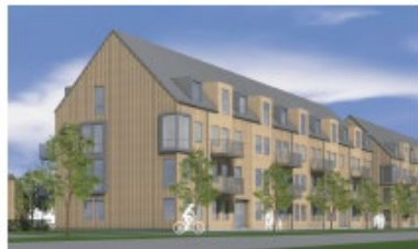
I am Home, 134 hyreslägenheter Inväntar att överläggad detaljplan ska vinna laga kraft