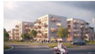
3Hus, 63 bostadsrätter Prel. byggstart våren 2021