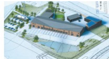
Trygghetens hus Tekniska serviceförvaltningen, Trelleborgs kommun