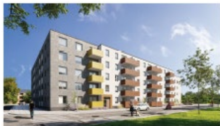
Acrinova, 60 hyreslägenheter Byggstart hösten 2020