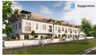
Flerbostadshus, radhus, fribyggartomter och förskola i norra delen av Trelleborgs tätort Bostäder (+1)