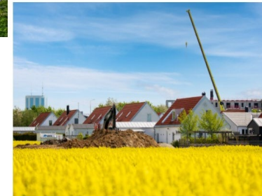
Den övergripande inriktningen för Trelleborgs utveckling är en fortsättning av redan pågående stadsutveckling med fortsättning och omvandling av befintliga stadsdelar.

Det är otroligt spännande tider i Trelleborgs kommun just nu. Trelleborgs stad står inför genomförande av det största stadsbyggnadsprojektet i stadens historia, Kuststad 2025.