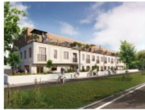
WE Conetration, 18 bostadsrätter Byggstart sommaren 2020