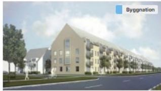
Flerbostadshus i norra Trelleborg Bostäder