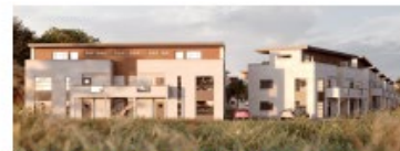
Östervång projekt, 100 bostadsrätter, privat projekt Pågående byggnation, prel. klart våren 2021