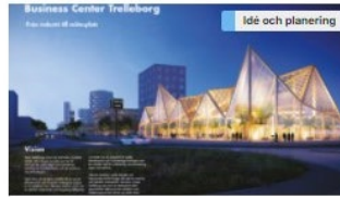
Business Center Trelleborg Kontor och handel